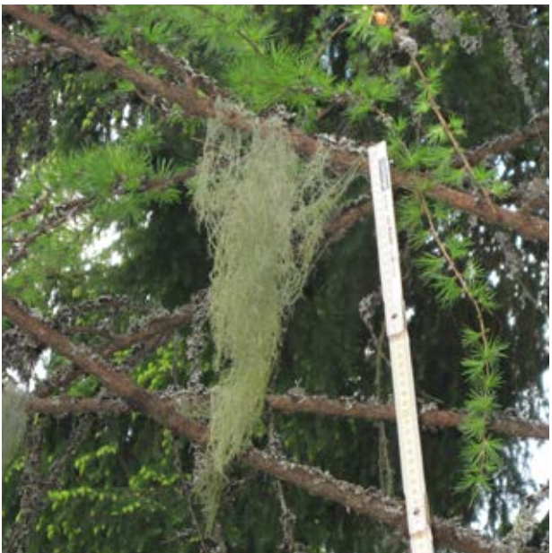
Gewöhnliche Bartflechte ( Usnea dasypoga )